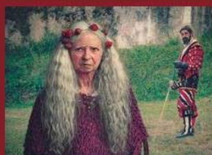
2. saria (2022) "La espada" José Luis García de Madinabeitia