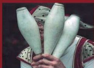
3. saria (2022) "Kukuutras!!!" Vladimiro García Villaverde